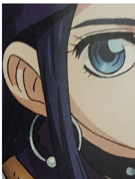
photo tirée d'un poster au CDI